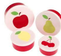
Fruit in stukjes in een fruitdoosje of banaan in een bananendoos