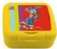
Koekje in een doosje